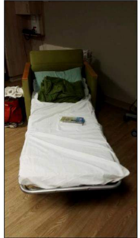
Mamma se kampbedjie