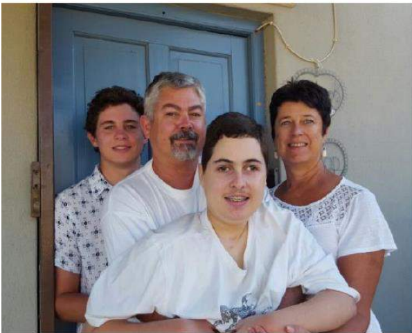
1 Januarie 2017 voor ons Onrushuis se blou deur