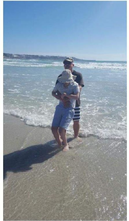
Loop in Yzerfontein se koue water