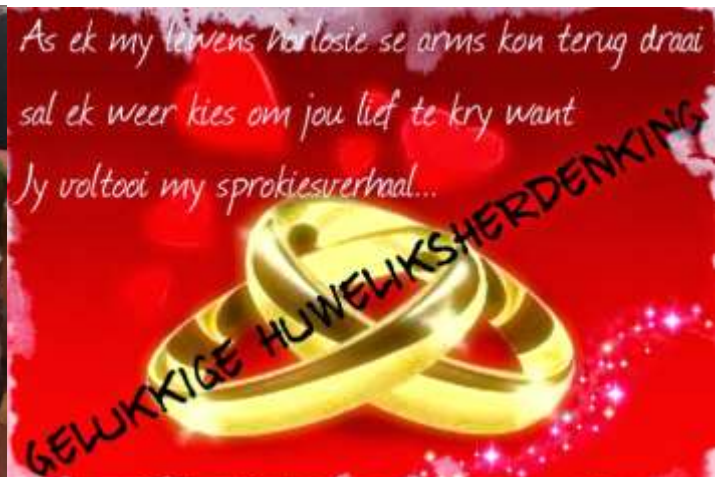
Rassie & Lizzie Erasmus was op 7 November, 'n allemintige 58 jaar getroud!! Ons bid julle alles wat mooi is toe, vol van die Here se goedheid en guns!!!